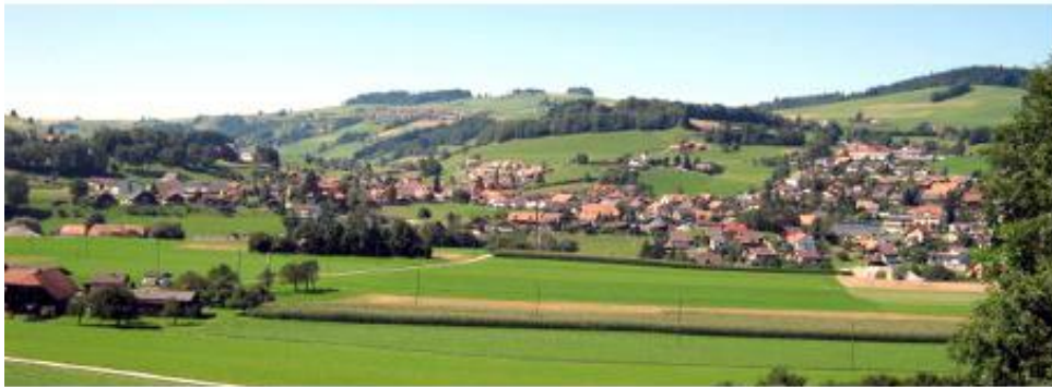
Toffen Kaufdorf Thurnen